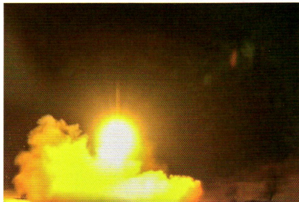
1月8日、イランは報復としてイラクにある米軍基地をミサイル攻撃