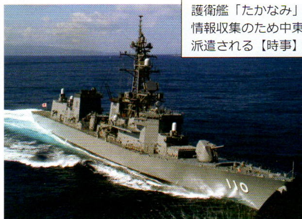
護衛艦「たかなみ」が情報収集のため中東に派遣される【時事】