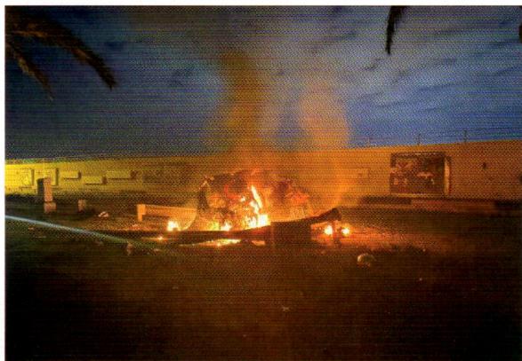
1月3日、イラクのバグダッド空港でイラン革命防衛隊司令官が米国の空爆により死亡